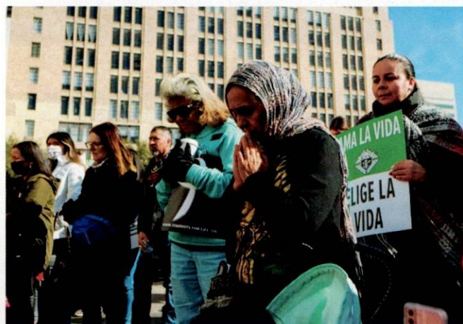
Fieles oran durante los eventos de la Marcha Anual por la Vida del Norte de Texas, el 14 de enero.