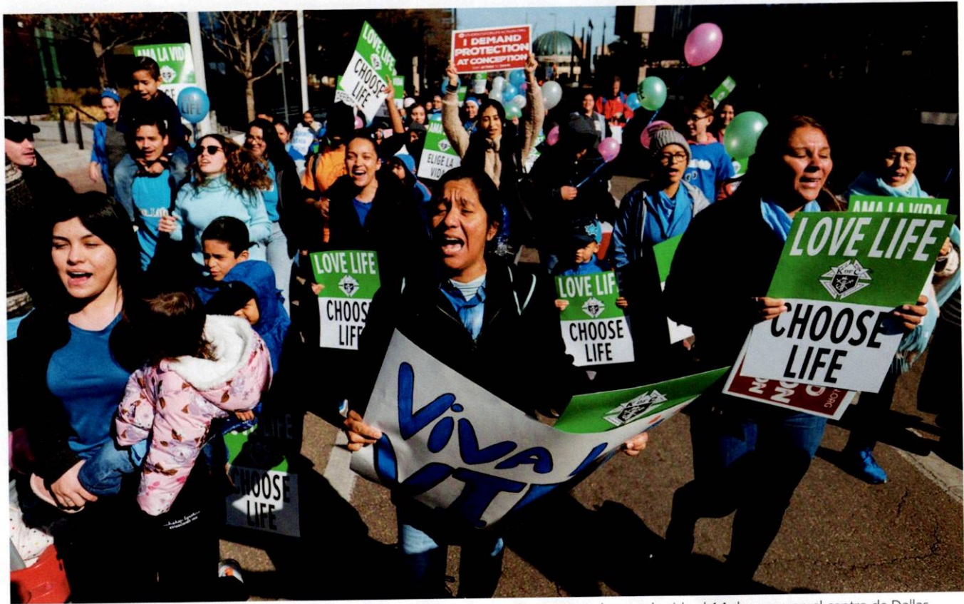
De acuerdo con cifras del Comité Católico Provida, más de 5,000 personas acudieron a marchar por la vida el 14 de enero en el centro de Dallas.